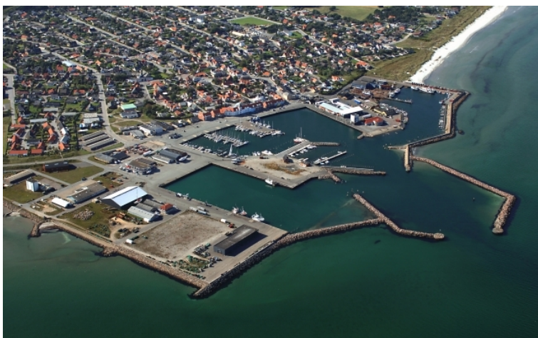
fotograferet juli 2010