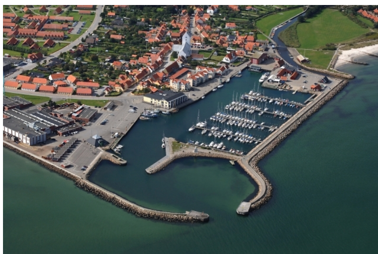
fotograferet juli 2010