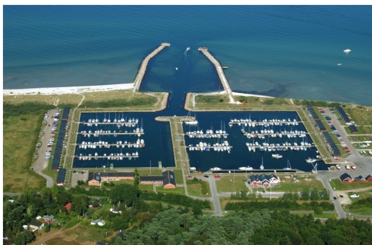
fotograferet august 2004