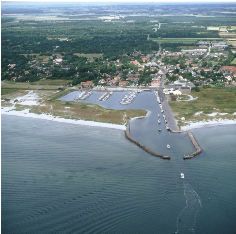
fotograferet juli 2000