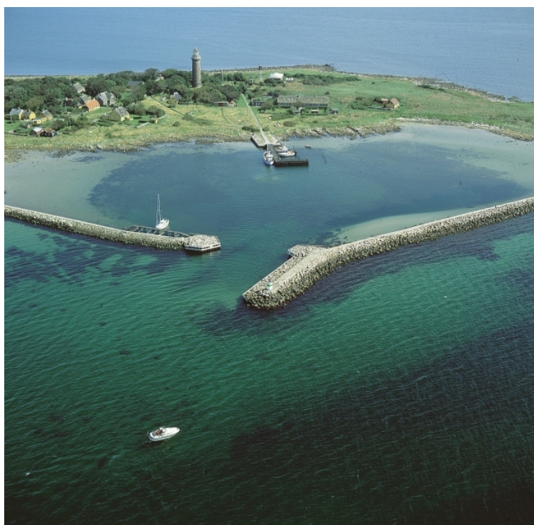
fotograferet maj 1997