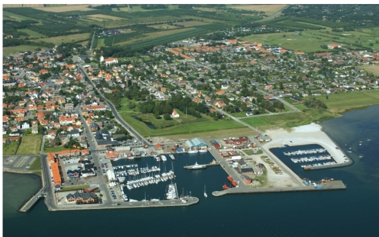
fotograferet august 2004