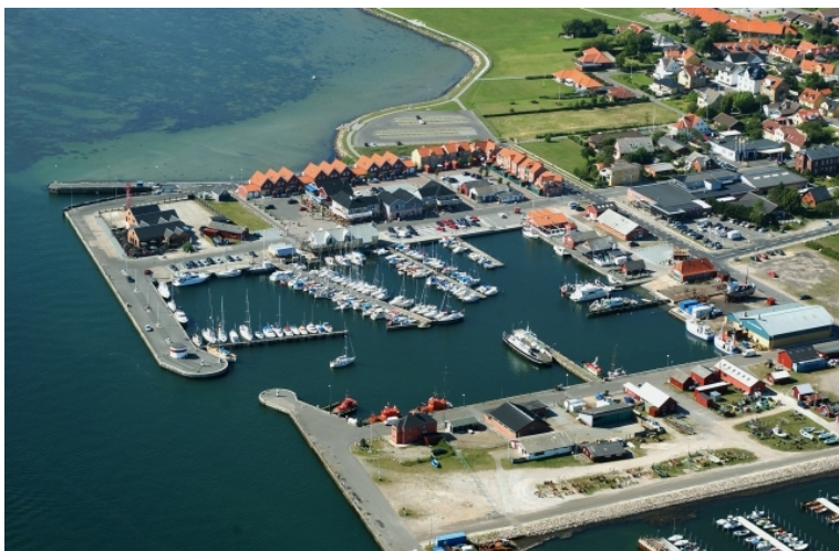
W-lige bassin - fotograferet august 2004