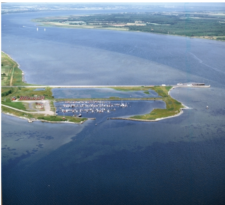
fotograferet juli 2000

Limfjorden, Langerak, Egense Hage 56°59,0'N 10°18,4'E - kort 106