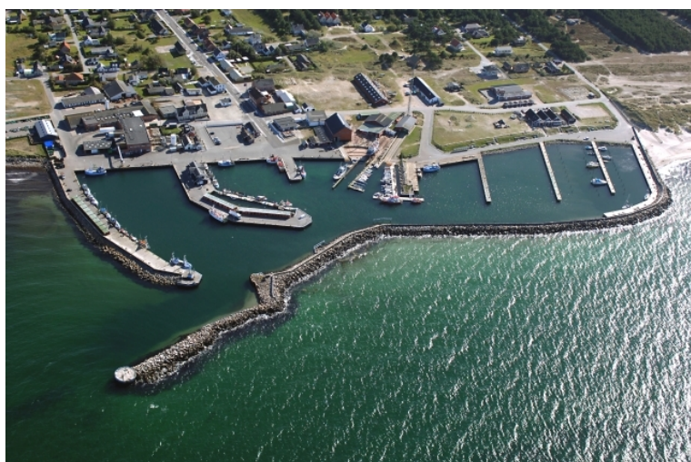
fotograferet juli 2010

Kattegat, Jegens Bugt, Læsø N-kyst 57°19,2'N 11°07,4'E - kort 123