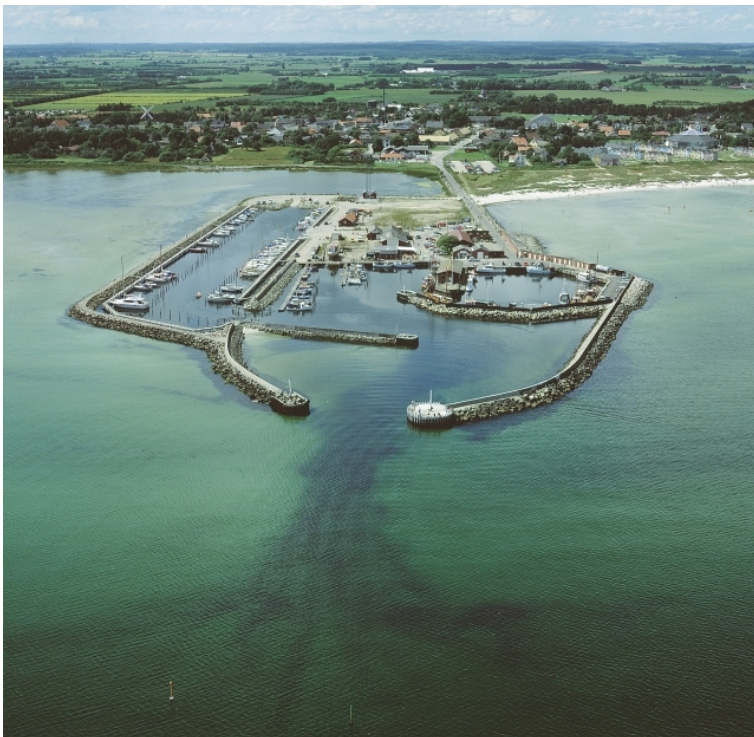
fotograferet maj 1997