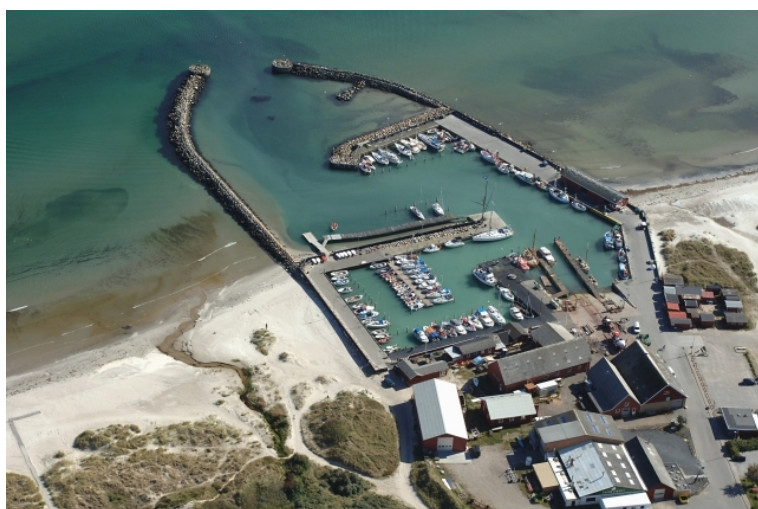
fotograferet juli 2010